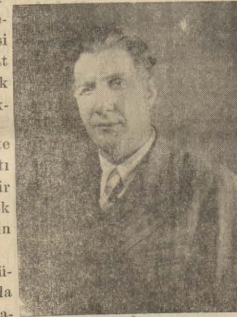
Tarsus Belediye reisi Celâl Ramazanoğlu

Park dahilinde hususi büfeler yaptırılması ve burada meşhur Tarsus kebabi, baklavası ve köpüklü ayran satılması için müsadeler verilmiştir.