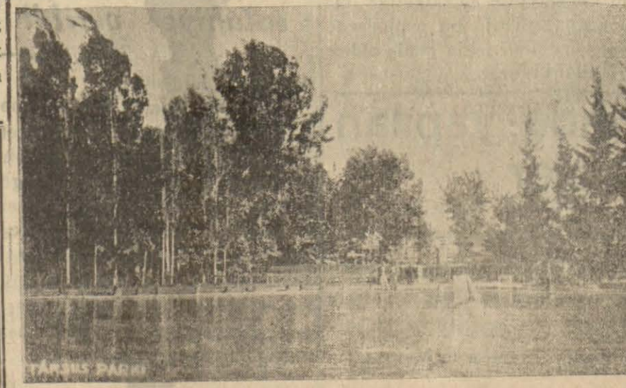
Tarsus parkından diğer bir manzara

Ramazanoğlu misafirlere her türlü teshilât gösterilmesi için bu işle muvazzaf memurlarla lâzım gelen direktifleri vermiştir.